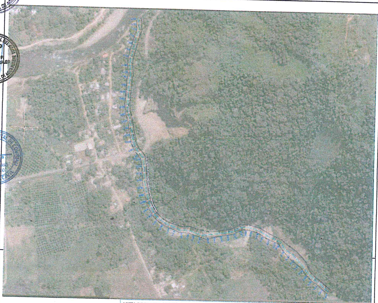
VISTA DE PLANTA DE TRAMO DE LIMPIEZA Y ENCAUSAMIENTO